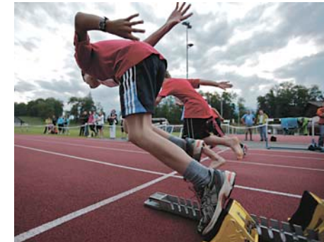
Bilder vom Schnällscht Chärnser